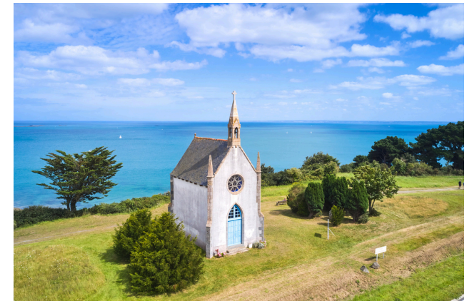
La chapelle Notre-Dame d'Espérance.