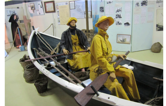
Voici ce qu'on peut voir au musée de Binic.

La station balnéaire des Godelins : Une station balnéaire est un quartier de ville au bord de la mer. Les gens y viennent pour les vacances. Ils s'installent dans des hôtels ou des maisons de vacances. La station balnéaire des Godelins a été construite au temps des trains à vapeur.