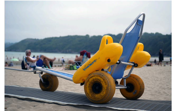
Les tiralos sont des fauteuils pour se baigner.