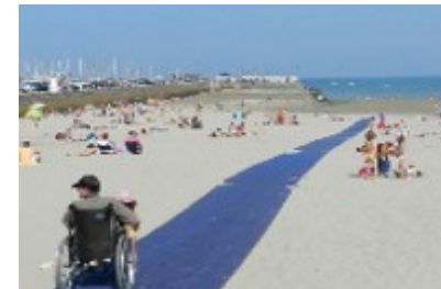
Voici un tapis de mise à l'eau.