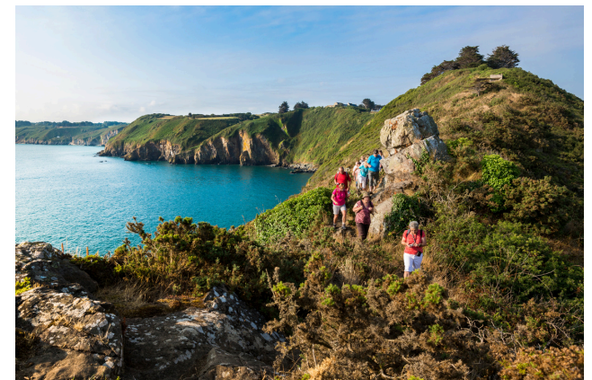
Photo des falaises de Plouha.