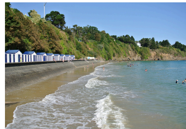
Photo de grande marée haute.