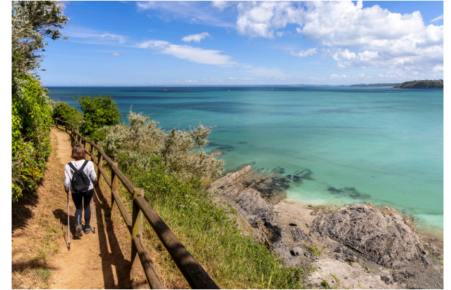
Le chemin le long de la côte.

Beaucoup de chemins pour les vélos tout terrain passent à Binic-Etables sur Mer. Vous pouvez demander la carte de ces chemins à l'office de tourisme.