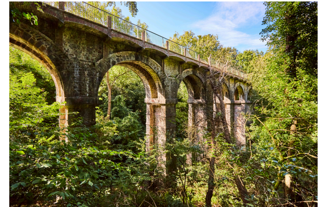
Le viaduc des Pourrhis.

Depuis la chapelle Notre-Dame d'Espérance on pouvait voir revenir de loin les bateaux qui rentraient au port de Binic.