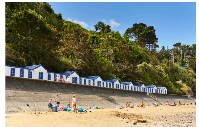
Des cabines de plage