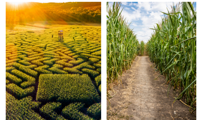
Voici un labyrinthe de maïs.

L'estran est la partie de sable découverte pendant les grandes marées.