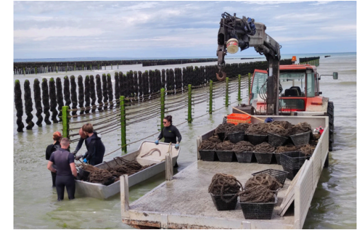
Voici un parc à moules.

Les moules sont des coquillages qui se mangent.