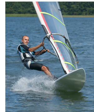
Une planche à voile