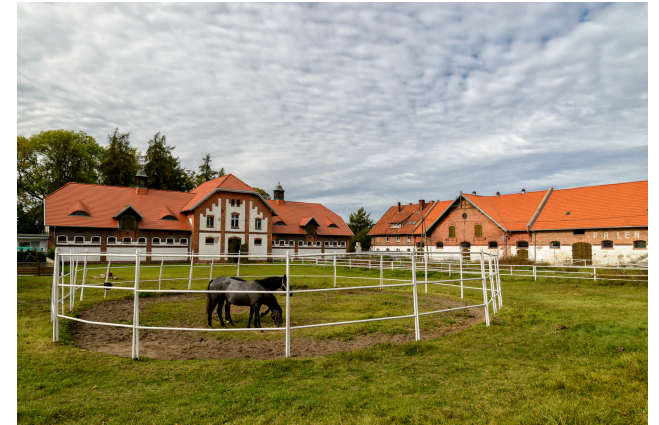
Voici un haras.

Rencontrer des serpents dans un terrarium . Les poissons peuvent vivre dans un aquarium, les serpents et les lézards peuvent vivre dans un terrarium.