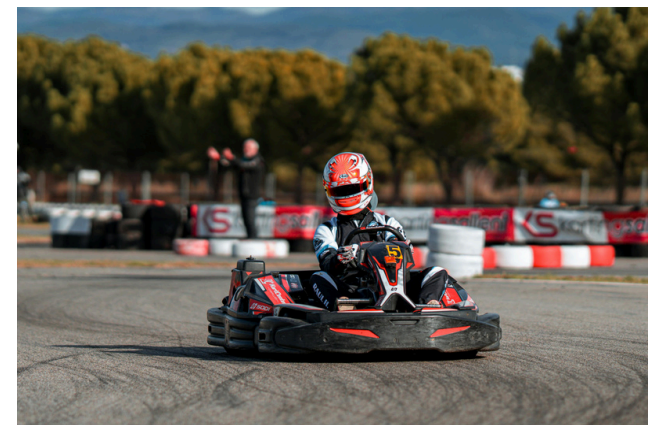
Cette personne fait du karting.