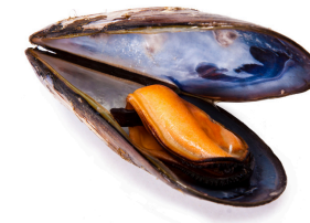
Voici une moule

Il est possible de se balader avec un guide sur l'estran pour voir les animaux et coquillages qui y vivent.