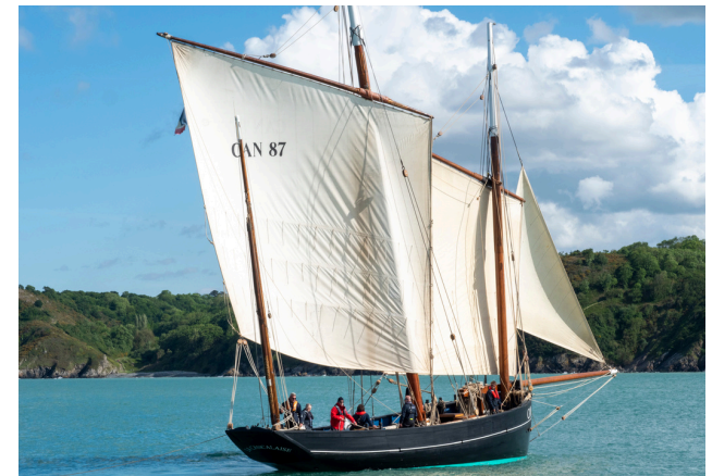
Voici un vieux gréement.