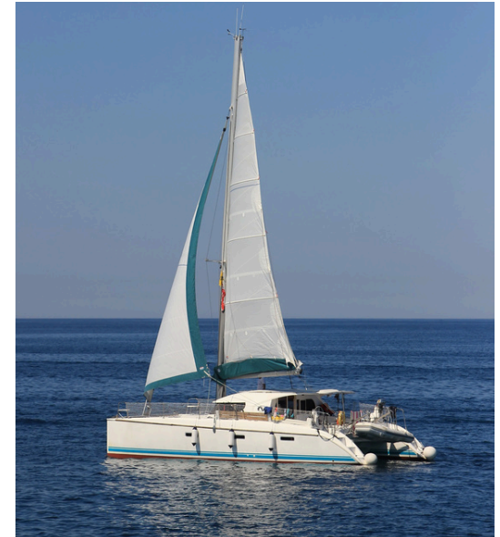
Voici un catamaran.

Il est possible de faire des balades en catamaran . ou des balades sur un vieux gréement ou des balades sur un bateau à moteur.