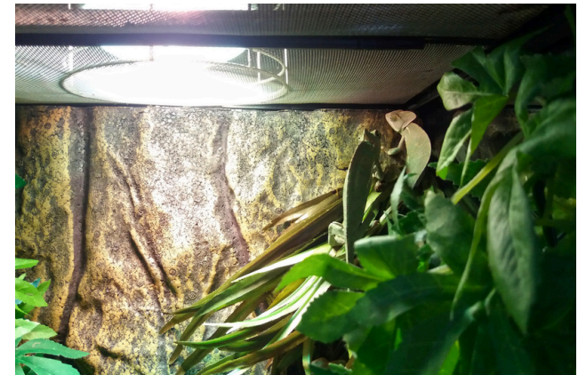
Voici un lézard dans un terrarium.