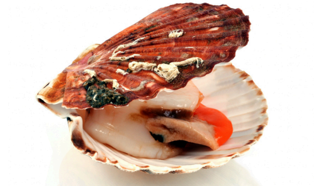
Photo d'une coquilles Saint-Jacques.

Quintin est une Petite Cité de Caractère.