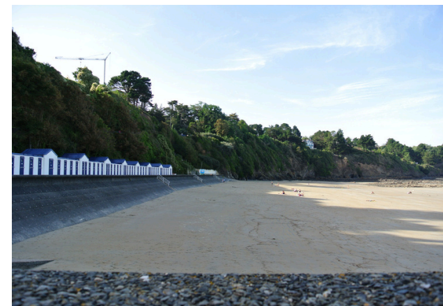
Photo de grande marée basse.

L'estran est la partie de sable découverte pendant les grandes marées.