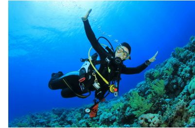
Elle fait de la plongée.