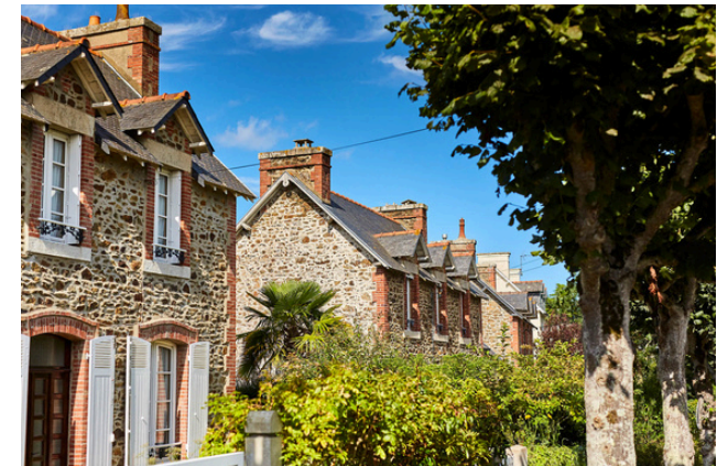
La station balnéaire des Godelins.