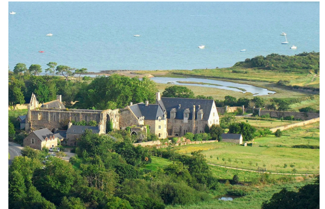
L'abbaye de Beauport.

Il est aussi possible de visiter des châteaux.