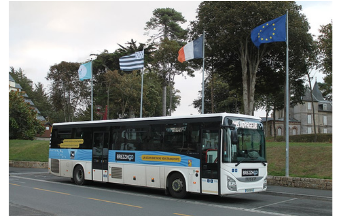
Photo du bus pour venir à Binic-Etables sur Mer.

On peut voir le trajet sur le site internet www.velomaritime.fr .