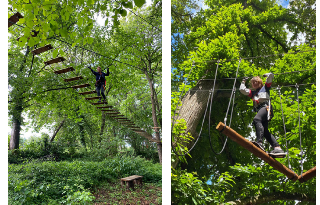
Ces personnes font de l'accrobranche

Il est également possible de pratiquer le golf ou le mini golf.