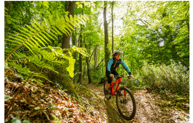
Cette personne fait du vélo tout terrain.