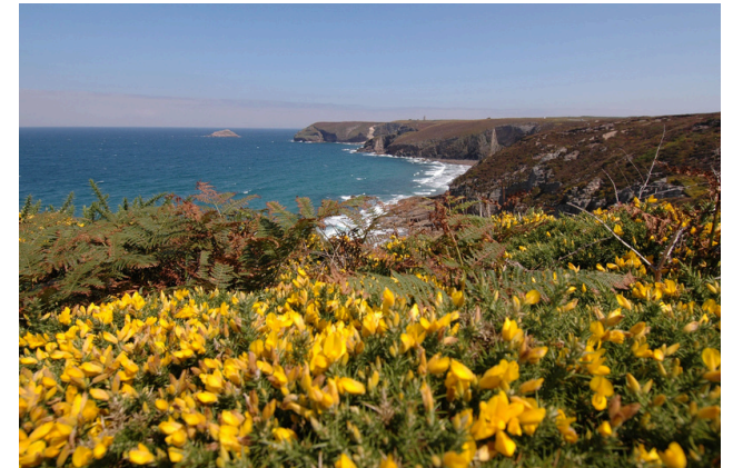
La lande du Cap Fréhel

Elle a aussi de belles maisons anciennes.