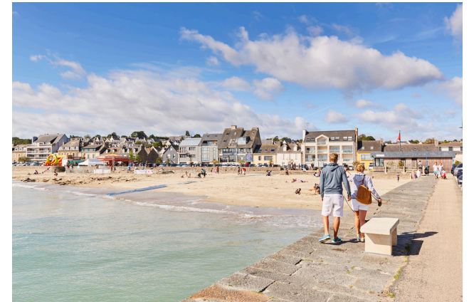
La plage de la Banche

Les plages de Binic-Etables sur Mer sont accessibles pour les personnes en fauteuil roulant sauf la plage du Corps de Garde.