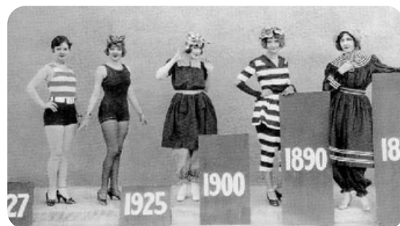
Evolution du costume de bain féminin

Sources : Livre "Etables-sur-Mer au travers des siècles" de M.F Holley