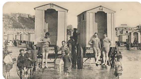
Costume de bain masculin (Boulogne/Mer)